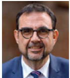
Staatsminister Klaus Holetschek