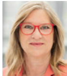
Dr. Sabine Nikolaus Boehringer Ingelheim Deutschland GmbH