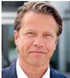
Robert Möller Helios Kliniken GmbH